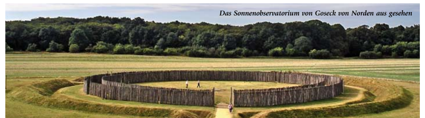
Das Sonnenobservatorium von Goseck von Norden aus gesehen

wie neuere Untersuchungen zeigen, auch den Termin des so genannten Frühlingssolstitiums. Der 01. Mai wird noch heute, zirka 7.000 Jahre später, gefeiert. Über den äquinoktialen Herbstpunkt liegen offenbar noch keine Erkenntnisse vor. Archäologische Befunde von Ausparungen in den Holzpalisaden lassen diese als so genannte Zeitmarken erscheinen, um neben dem 01. Mai auch den 09. April, den 01. August und den 04. September zu markieren. Damit wäre es möglich, dass auch die Walpurgisnacht gut 7.000 Jahre alt ist.