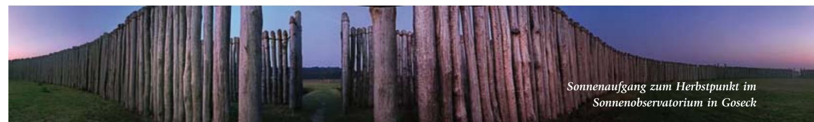
Sonnenaufgang zum Herbstpunkt im Sonnenobservatorium in Goseck

Das Sonnenobservatorium in Goseck verdeutlichte den Menschen bereits vor rund 7.000 Jahren die wesentlichen jahreszeitlichen astronomischen Kennzeichen: die Sommer- und Wintersonnenwende und,