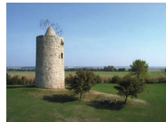
Pole-Aerial Photography an der Eichstädter Warte bei Langeneichstädt in 8 Meter Höhe